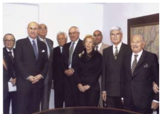
• El Sr. Embajador, Rector IUNIR, autoridades AMA.