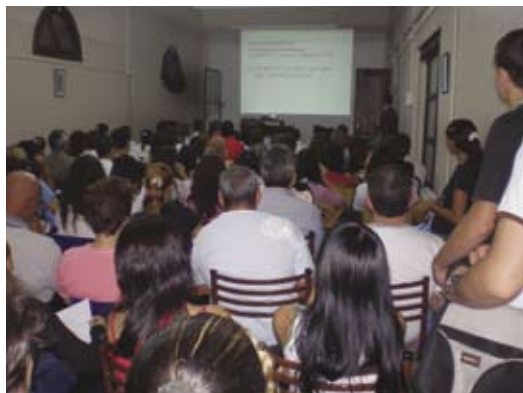
• Alta concurrencia a la charla.

La charla giró en torno a la prevención, el diagnóstico y al tratamiento de esta enfermedad para lo cual es necesario contar con el apoyo de los ciudadanos puesto que, sólo con el trabajo conjunto de los diferentes integrantes de la comunidad, es posible tener éxito para su erradicación.