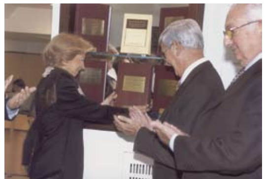
• Exposición de las distintas traducciones del Código de Ética en hall de la AMA.